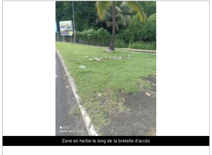
Zone en herbe le long de la bretelle d'accès