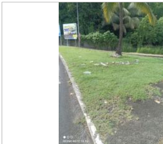
Zone en herbe le long de la bretelle d'accès