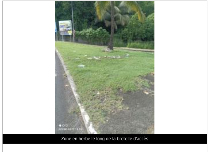
Zone en herbe le long de la bretelle d'accès