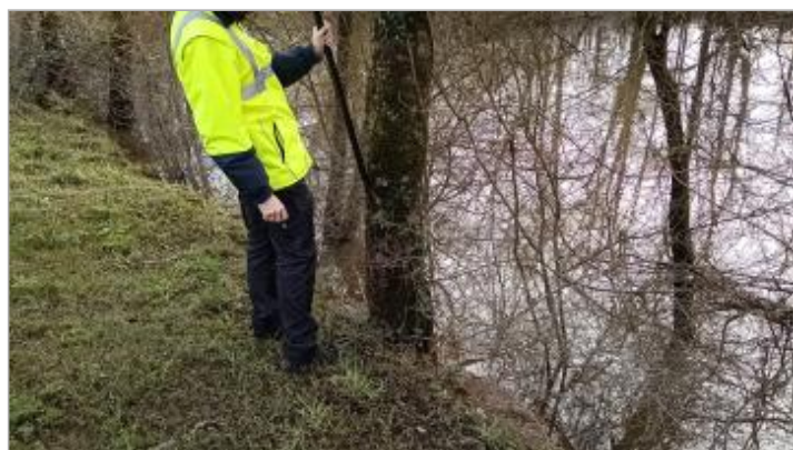
Relevé de la laisse d'inondation sur le tronc d'un arbre le 05/02/2025

SOURCE DE REPÉRAGE : SPC MLA RECENSEMENT JANVIER 2025 BASSIN DE LA VILAINE - 09/02/2025