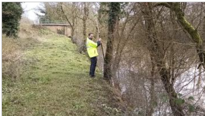
Parc entre l'Isac et le canal de Nantes à Brest le 05/02/2025