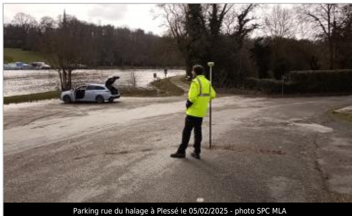
Parking rue du halage à Plessé le 05/02/2025