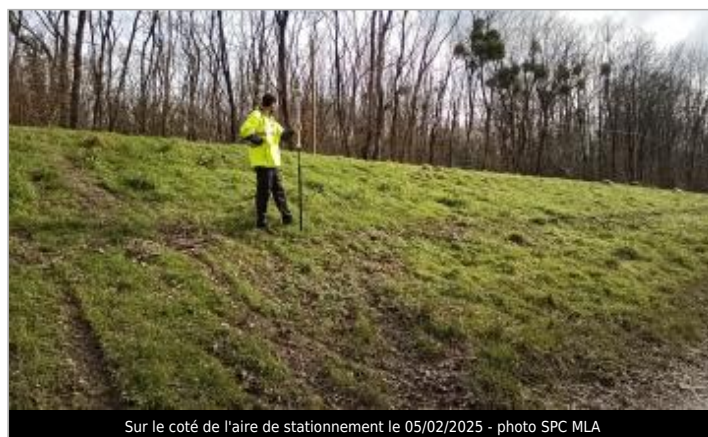
Sur le coté de l'aire de stationnement le 05/02/2025

GÉOLOCALISATION Coordonnées WGS84 : X: -1.92597251 / Y: 47.49643690 Coordonnées RGF93 (Lambert 93) X: 329373.2 / Y: 6722239.13 Coordonnées RGF93 (ETRS89) : X: -1.9259725 / Y: 47.4964369 Code Hydro: J9--0250 Rive de référence: Gauche