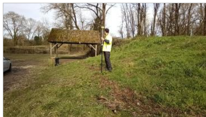
Relevé de la laisse d'inondation sur le coté de l'aire de stationnement le 05/02/2025

GÉNÉRAL Code : SPC_44068_02_2025 Date de mise à jour : 21/10/2025 Auteur : SPC VCB