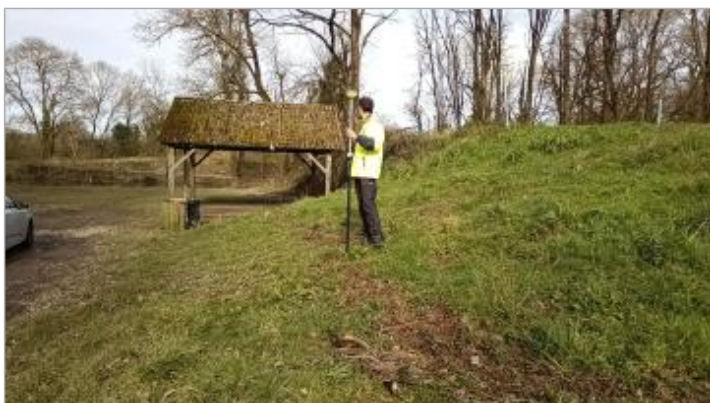
Relevé de la laisse d'inondation sur le coté de l'aire de stationnement le 05/02/2025