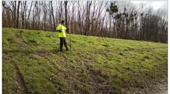
Sur le coté de l'aire de stationnement le 05/02/2025

Coordonnées WGS84 : X: -1.92597251 / Y: 47.49643690