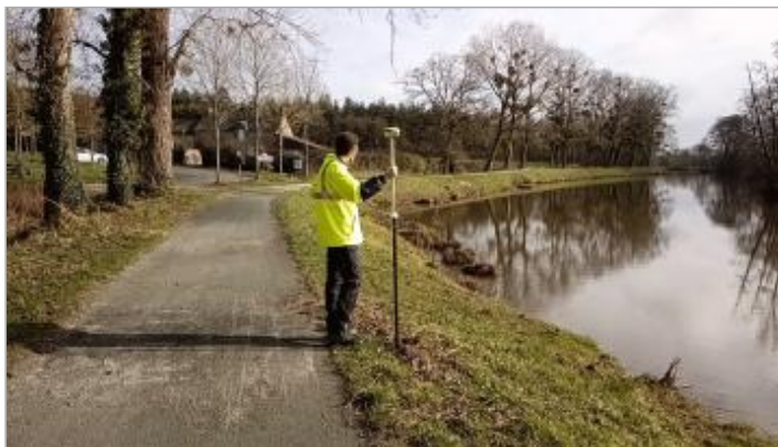
Chemin de halage à la Rouaudais le 05/02/2025

GÉOLOCALISATION Coordonnées WGS84 : X: -1.86398773 / Y: 47.46703280 Coordonnées RGF93 (Lambert 93) X: 333829.87 / Y: 6718689.7 Coordonnées RGF93 (ETRS89) : X: -1.8639877 / Y: 47.4670328 Code Hydro: J9--0250 Rive de référence: Droite