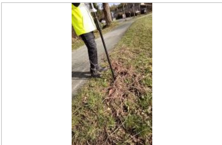
Relevé de la laisse d'inondation sur le bord du chemin de halage le 05/02/2025