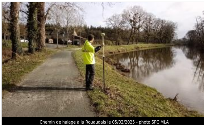
Chemin de halage à la Rouaudais le 05/02/2025