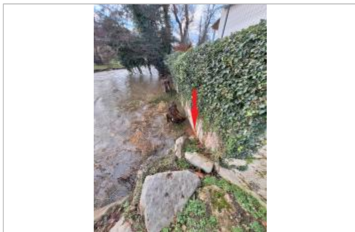
Laisse de crue à 20 cm/sol au pied du mur.

Altitude calculée de l'eau (en m) : 27.48 m