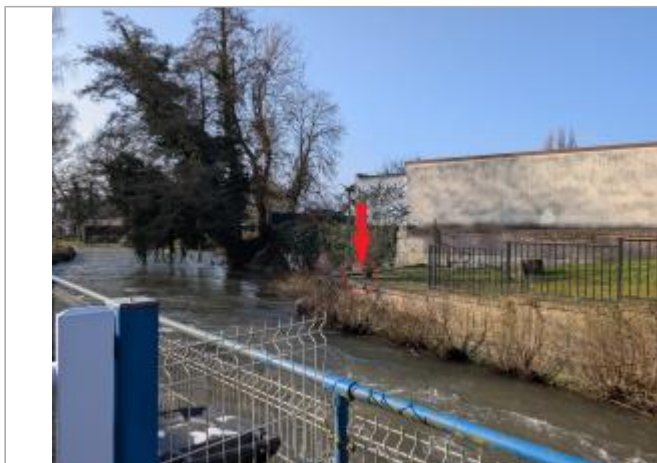
Vue depuis la rue Pouyer Quartier.

Coordonnées WGS84 : X: 1.35809890 / Y: 49.35886150