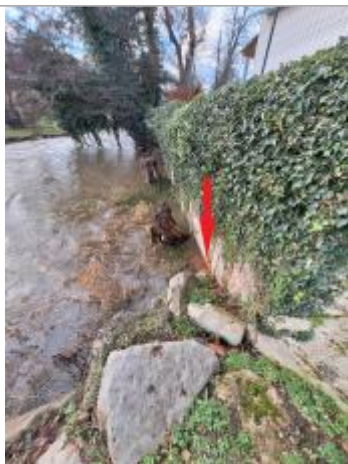
Laisse de crue à 20 cm/sol au pied du mur.