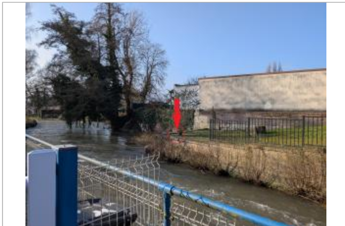
Vue depuis la rue Pouyer Quartier.