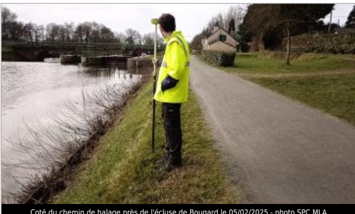
Coté du chemin de halage près de l'écluse de Bougard le 05/02/2025

GÉOLOCALISATION Coordonnées WGS84 : X: -1.83888591 / Y: 47.47485270 Coordonnées RGF93 (Lambert 93) X: 335770.41 / Y: 6719440.67 Coordonnées RGF93 (ETRS89) : X: -1.8388859 / Y: 47.4748527 Code Hydro: J9--0250 Rive de référence: Droite