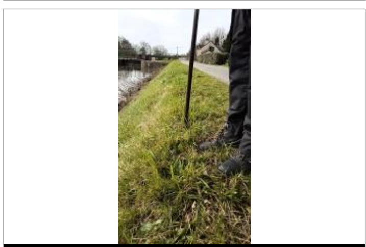
Relevé de la laisse d'inondation sur la berge le 05/02/2025

GÉNÉRAL Code : SPC_44015_07_2025 Date de mise à jour : 21/10/2025 Auteur : SPC VCB