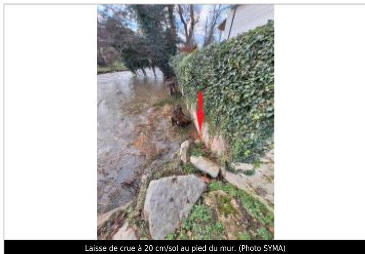
Laisse de crue à 20 cm/sol au pied du mur.

Altitude calculée de l'eau (en m) : 27.48