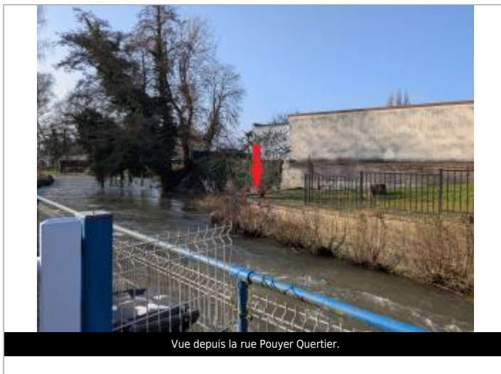
Vue depuis la rue Pouyer Quartier.