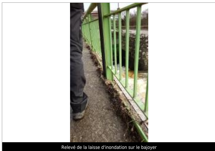
Relevé de la laisse d'inondation sur le bajoyer

SOURCE DE REPÉRAGE : SPC MLA RECENSEMENT JANVIER 2025 BASSIN DE LA VILAINE - 09/02/2025