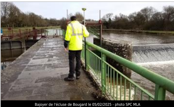
Bajoyer de l'écluse de Bougard le 05/02/2025

GÉOLOCALISATION Coordonnées WGS84 : X: -1.83957405 / Y: 47.47453430 Coordonnées RGF93 (Lambert 93) X: 335716.52 / Y: 6719408.54 Coordonnées RGF93 (ETRS89) : X: -1.8395741 / Y: 47.4745343 Code Hydro: J9--0250 Rive de référence: Droite