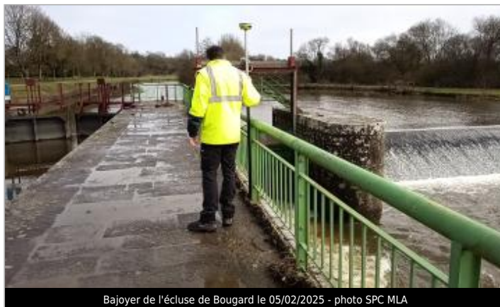
Bajoyer de l'écluse de Bougard le 05/02/2025