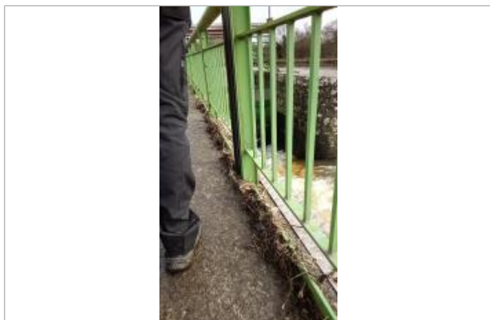
Relevé de la laisse d'inondation sur le bajoyer

Altitude calculée de l'eau (en m) : 11.769 m