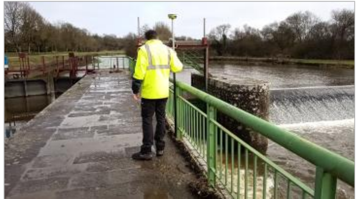
Bajoyer de l'écluse de Bougard le 05/02/2025

Coordonnées WGS84 : X: -1.83957405 / Y: 47.47453430