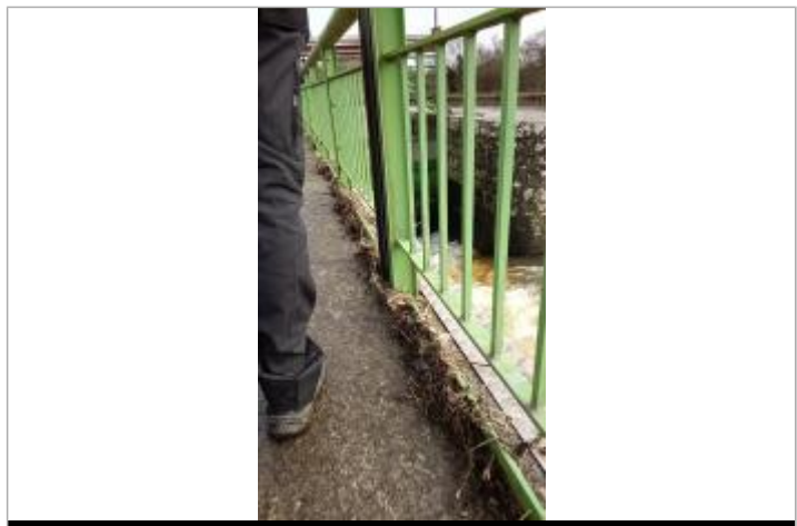
Relevé de la laisse d'inondation sur le bajoyer

GÉNÉRAL Code : SPC_44015_06_2025 Date de mise à jour : 21/10/2025 Auteur : SPC VCB