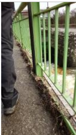
Relevé de la laisse d'inondation sur le bajoyer

Altitude calculée de l'eau (en m) : 11.769 m