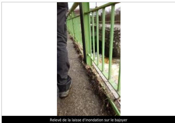
Relevé de la laisse d'inondation sur le bajoyer

SOURCE DE REPÉRAGE : SPC MLA RECENSEMENT JANVIER 2025 BASSIN DE LA VILAINE - 09/02/2025