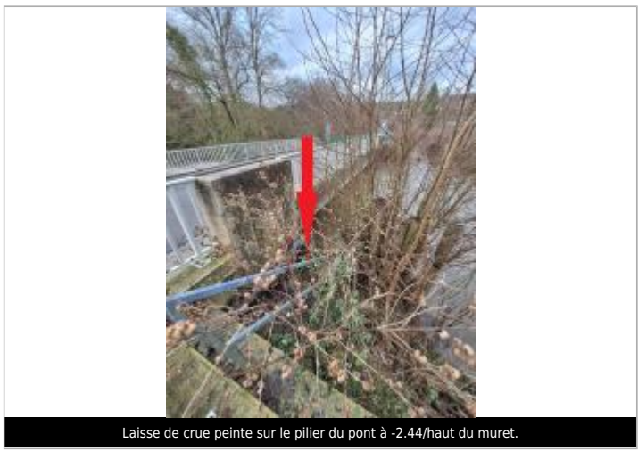
Laisse de crue peinte sur le pilier du pont à -2.44/hauteur du muret.

MARQUE Maximum de l'inondation : Oui Visibilité : Oui État du repère : Moyen Pérennité : Moyenne Repère calculé : Non PHEC : Non