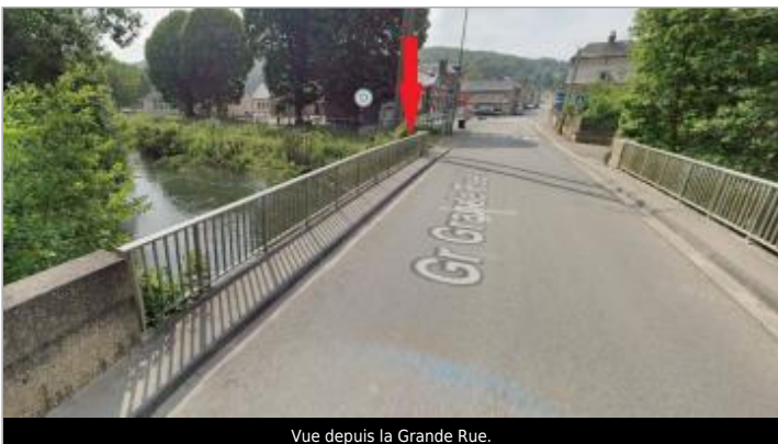
Vue depuis la Grande Rue.

GÉOLOCALISATION Coordonnées WGS84 : X: 1.32621488 / Y: 49.35375640 Coordonnées RGF93 (Lambert 93) X: 578369.32 / Y: 6918423.87 Coordonnées RGF93 (ETRS89) : X: 1.3262149 / Y: 49.3537564 Code Hydro: H32-0400 Rive de référence: Gauche