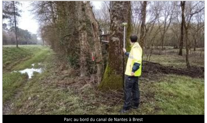
Parc au bord du canal de Nantes à Brest