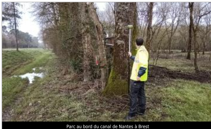
Parc au bord du canal de Nantes à Brest