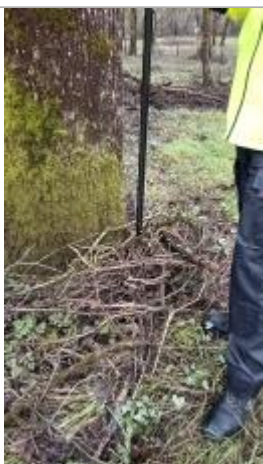
relevé de la laisse d'inondation sur un arbre du parc

Altitude calculée de l'eau (en m) : 17.398