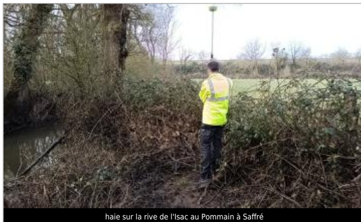
haie sur la rive de l'Isac au Pommain à Saffré