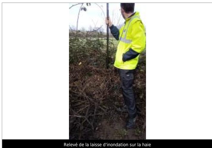
Relevé de la laisse d'inondation sur la haie

Altitude calculée de l'eau (en m) : 19.705 m