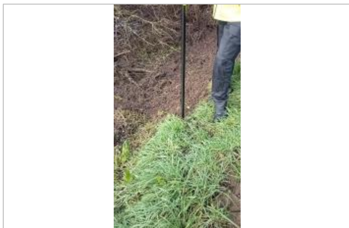
Relevé de la laisse d'inondation sur le bord de la route

Altitude calculée de l'eau (en m) : 22.199 m