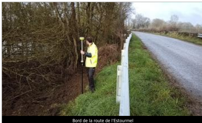
Bord de la route de l'Estourmel

Coordonnées WGS84 : X: -1.61226428 / Y: 47.47586320