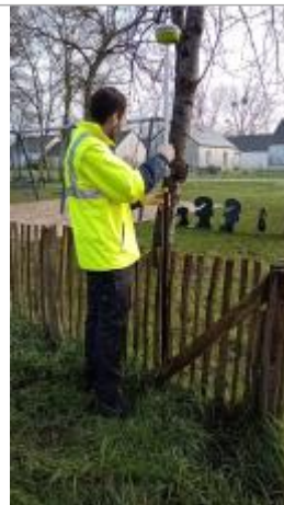
Parc et jeux le long de l'Isac lors du relevé le 05/02/2025

Coordonnées WGS84 : X: -1.57852340 / Y: 47.50004710 Coordonnées RGF93 (Lambert 93) X: 355507.86 / Y: 6721066.13 Coordonnées RGF93 (ETRS89) : X: -1.5785234 / Y: 47.5000471 Code Hydro: Rive de référence: Gauche