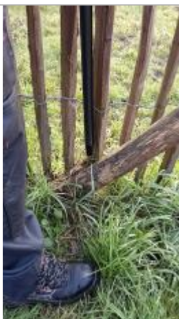
Laisse d'inondation sur les ganivelles du parc le 05/02/2025

Méthode : Non renseigné Organisme : SPC Maine - Loire aval Commentaires sur le nivellement : Le niveau de la laisse d'inondation sur la végétation est jugée douteuse par le SPC MLA lors du relevé avec une assez forte incertitude d'où l'indication de +/-10cm Référence nivelée : Marque d'inondation Description référence du repère : Laisse d'inondation sur les ganivelles du parc Système altimétrique : NGF IGN 1969 (système normal) Altitude de la référence (en m) : 26.256 m Altitude calculée de l'eau (en m) : 26.256 m