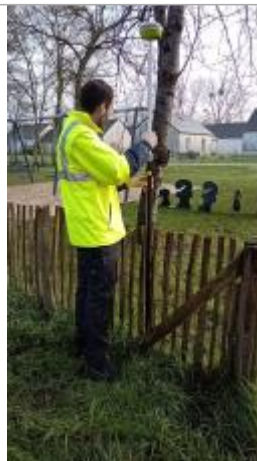
Parc et jeux le long de l'Isac lors du relevé le 05/02/2025