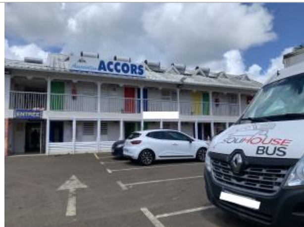
Vue depuis le parking

Coordonnées WGS84 : X: -61.52030190 / Y: 16.25781240