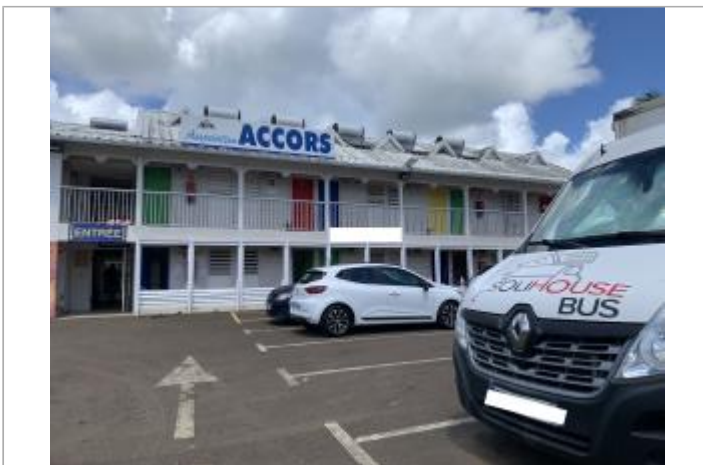
Vue depuis le parking