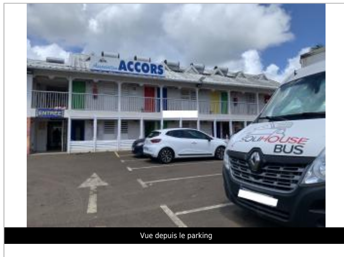
Vue depuis le parking