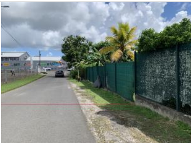
Maximum de l'emprise inondée