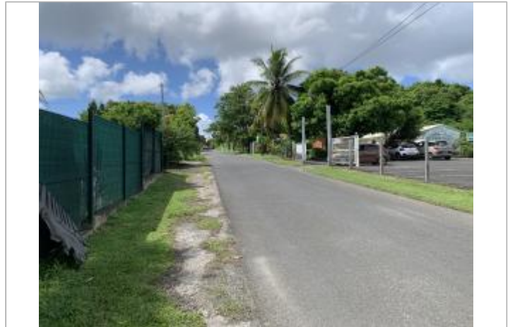
Vue depuis l'intersection