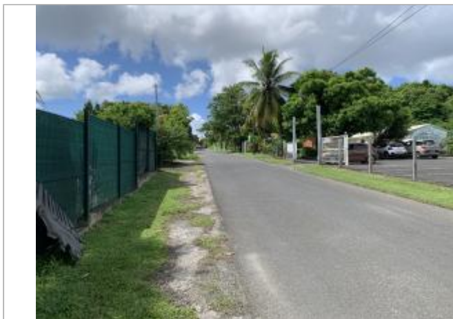
Vue depuis l'intersection

Coordonnées WGS84 : X: -61.51530190 / Y: 16.25603690