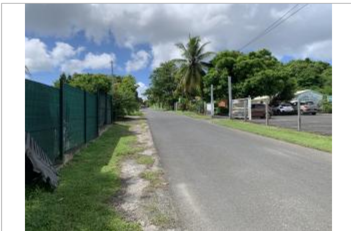
Vue depuis l'intersection