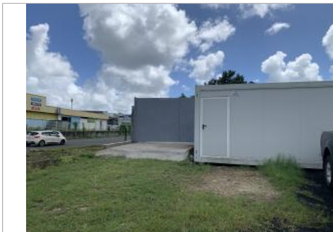
Vue depuis la route