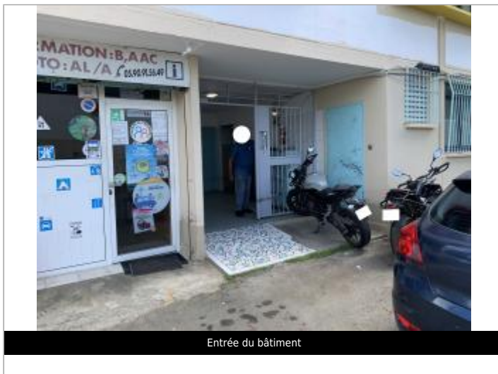
Entrée du bâtiment