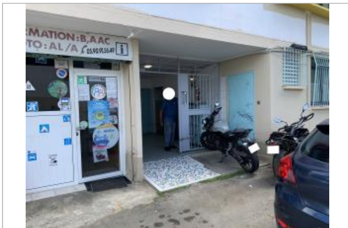
Entrée du bâtiment