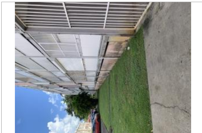
Façade extérieure de la résidence