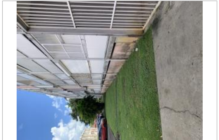
Façade extérieure de la résidence