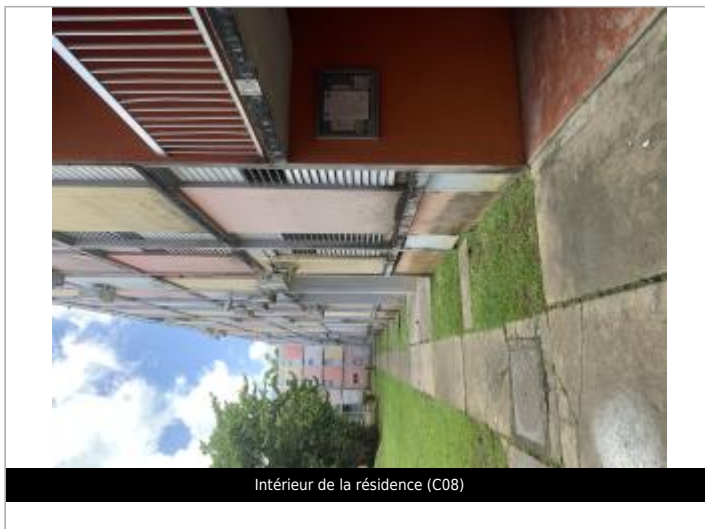
Intérieur de la résidence (C08)