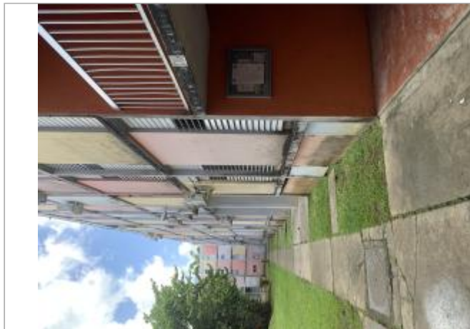
Intérieur de la résidence (C08)

Coordonnées RGF93 (ETRS89) : X: -61.5231494 / Y: 16.2512068