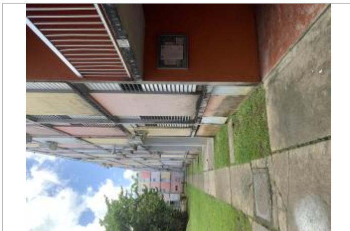
Intérieur de la résidence (C08)