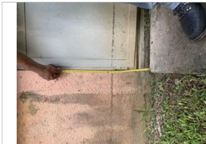
Dépôts de matières solides