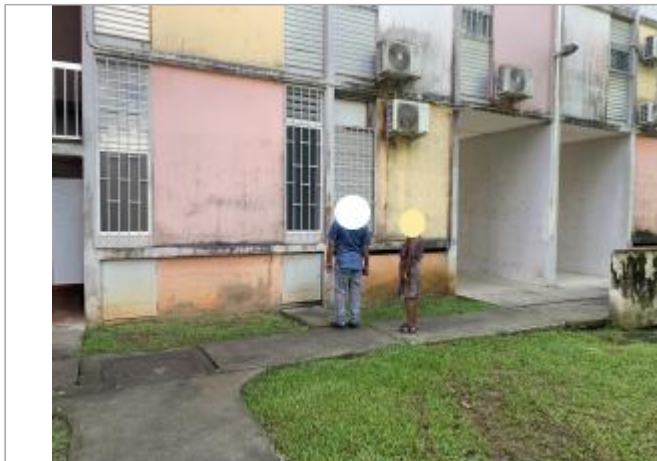
Intérieur de la résidence (C11)

Coordonnées WGS84 : X: -61.52279680 / Y: 16.25152290