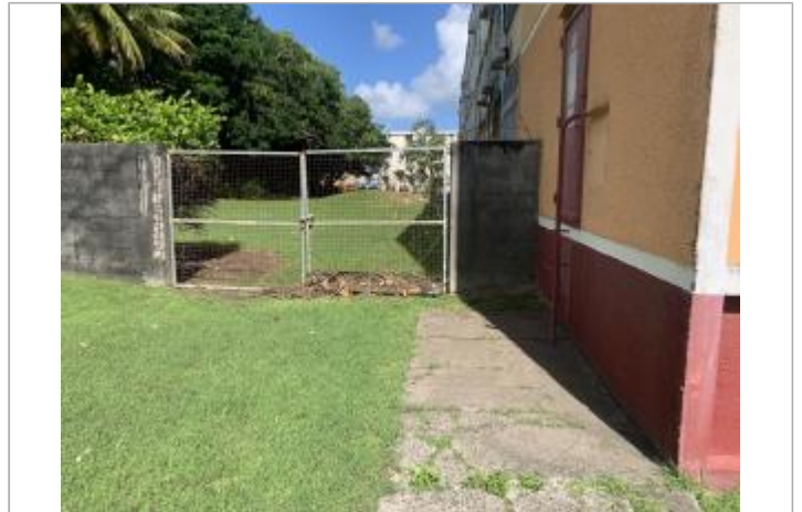
Portail blanc à proximité du bâti