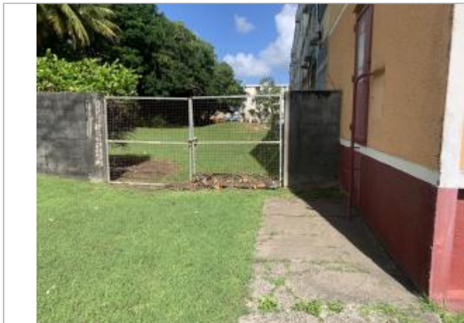
Portail blanc à proximité du bâti

Coordonnées WGS84 : X: -61.52239000 / Y: 16.25180630