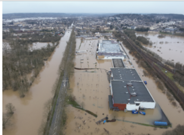
Centre commercial à Saint-Nicolas-de-Redon le 28/01/2025