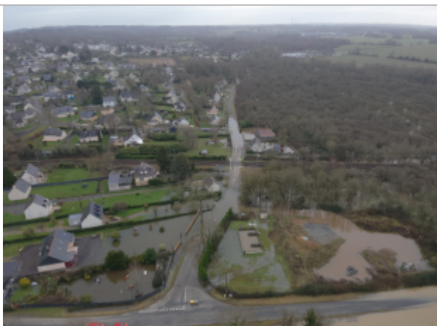
Survol en drone du quartier de la Broussais à Saint-Nicolas-de-Redon le 31/01/2025