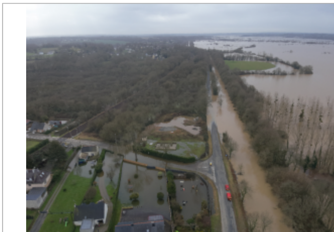
Survol drone du quartier de la Broussais à Saint-Nicolas-de-Redon le 31/01/2025