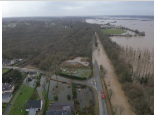
Survol drone du quartier de la Broussais à Saint-Nicolas-de-Redon le 31/01/2025

Coordonnées WGS84 : X: -2.06929158 / Y: 47.63933820