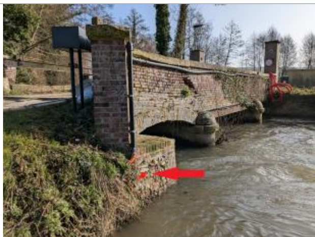
Laisse de crue à - 85 cm/macaron IGN (41.718 m)

Altitude calculée de l'eau (en m) : 40.868