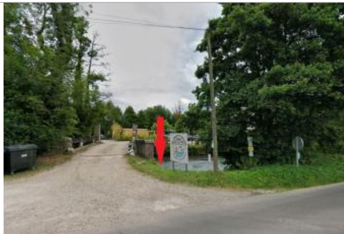
Vue depuis la RD1.