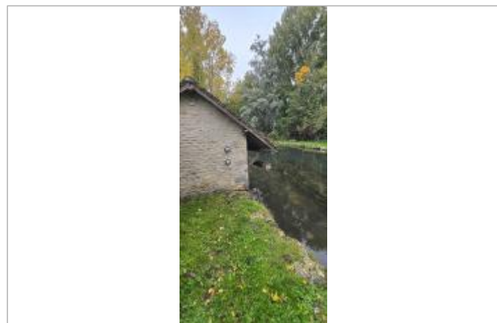
Repère sur le mur du lavoir rive droite route de Puiseaux à Ondreville-sur-Essonne

MARQUE Maximum de l'inondation : Oui Visibilité : Oui