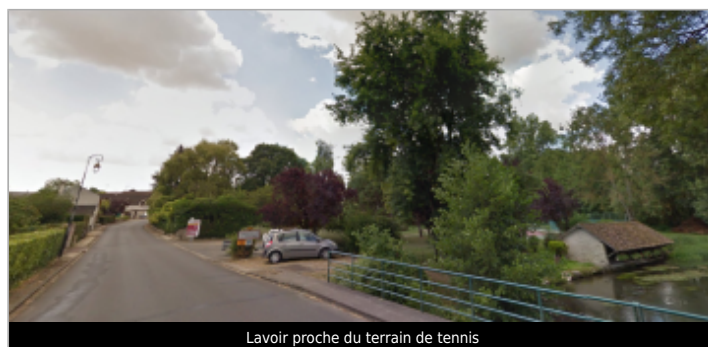
Lavoir proche du terrain de tennis

GÉOLOCALISATION Coordonnées WGS84 : X: 2.40845740 / Y: 48.20255700 Coordonnées RGF93 (Lambert 93) X: 656052.04 / Y: 6789298.36 Coordonnées RGF93 (ETRS89) : X: 2.4084574 / Y: 48.202557 Code Hydro: F45-0400 Rive de référence: