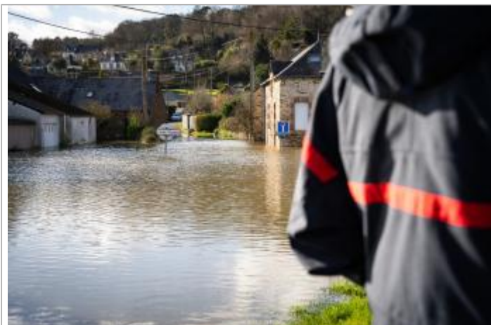
Début de l'impasse de la rue à Aucfer-Rieux le 30/01/2025