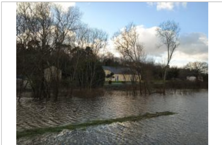
RD 114 à Rieux inondée le 30/01/2025 près du pic de l'inondation

MARQUE Maximum de l'inondation : Oui Visibilité : Oui État du repère : Bon Pérennité : Longue Repère calculé : Non PHEC : Non