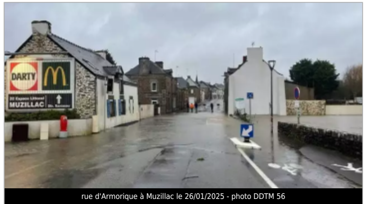
rue d'Armorique à Muzillac le 26/01/2025

GÉOLOCALISATION Coordonnées WGS84 : X: -2.48832918 / Y: 47.55380910 Coordonnées RGF93 (Lambert 93) X: 287569.18 / Y: 6731387.36 Coordonnées RGF93 (ETRS89) : X: -2.4883292 / Y: 47.5538091 Code Hydro: Rive de référence: Gauche