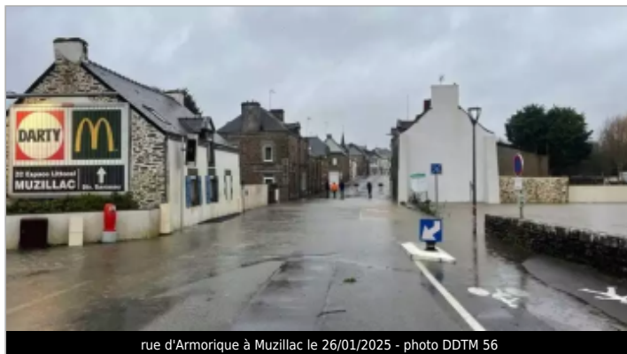
rue d'Armorique à Muzillac le 26/01/2025