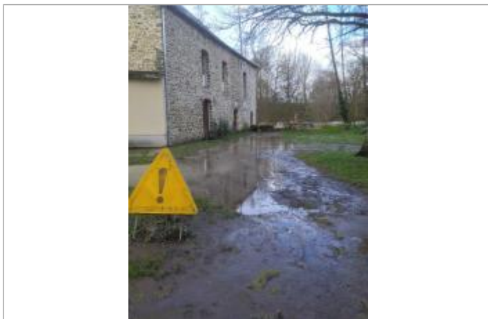
Le moulin de l'Ardouais à Pléchatel le 30/01/2025