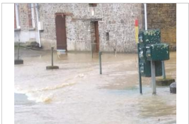
lieu-dit "Quenouard" à Pléchatel le 30/01/2025

MARQUE Maximum de l'inondation : Non Visibilité : Oui État du repère : Bon Pérennité : Longue Repère calculé : Non PHEC : Non