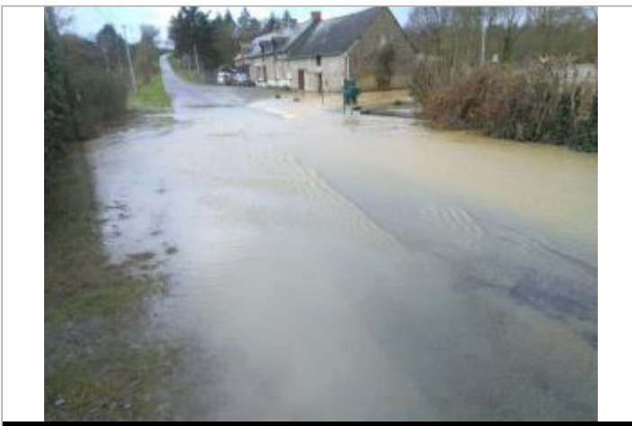
lieu-dit "Quenouard" à Pléchatel le 30/01/2025

GÉOLOCALISATION Coordonnées WGS84 : X: -1.67080765 / Y: 47.87003400 Coordonnées RGF93 (Lambert 93) : X: 351002.44 / Y: 6762507.18 Coordonnées RGF93 (ETRS89) : X: -1.6708077 / Y: 47.870034 Code Hydro: Rive de référence: Gauche