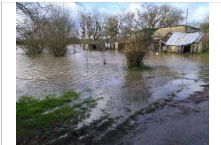
Lieu-dit "Le pont neuf" à Pléchatel le 30/01/2025

GÉOLOCALISATION Coordonnées WGS84 : X: -1.77834850 / Y: 47.85124280 Coordonnées RGF93 (Lambert 93) : X: 342850.54 / Y: 6760903.83 Coordonnées RGF93 (ETRS89) : X: -1.7783485 / Y: 47.8512428 Code Hydro: J---0060 Rive de référence: Gauche