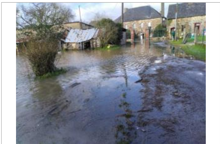
Maisons au lieu-dit "Le pont neuf" à Pléchatel le 30/01/2025

MARQUE Maximum de l'inondation : Non Visibilité : Non État du repère : Bon Pérennité : Longue Repère calculé : Non PHEC : Non