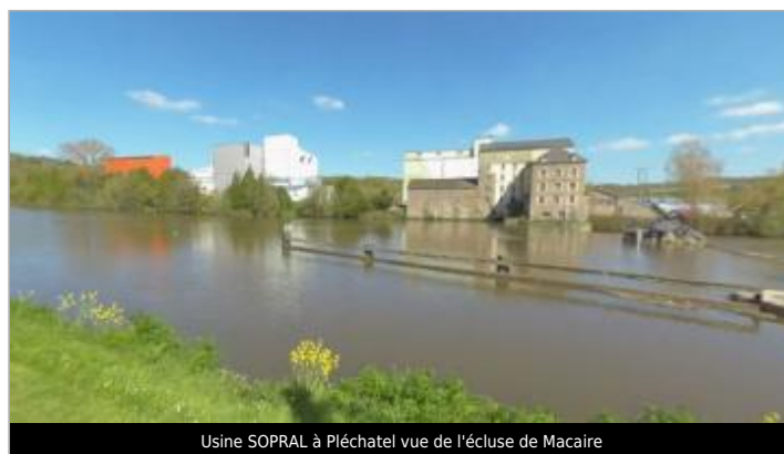
Usine SOPRAL à Pléchatel vue de l'écluse de Macaire