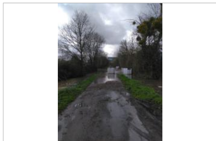
Intérieur de l'usine SOPRAL à Pléchatel le 30/01/2025