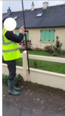
Muret devant le n°13 rue de Louvain le 29/01/2025