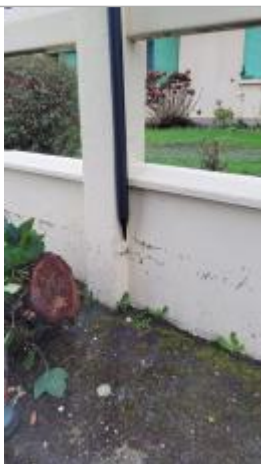
Relevé de la laisse d'inondation sur le muret le 29/01/2025