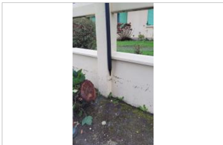
Relevé de la laisse d'inondation sur le muret le 29/01/2025