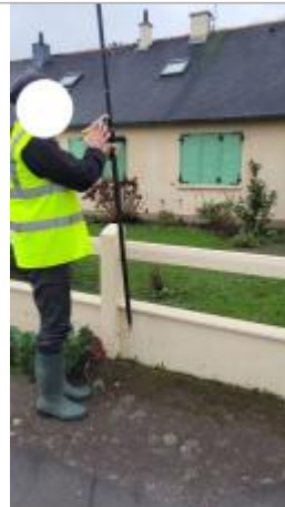
Muret devant le n°13 rue de Louvain le 29/01/2025