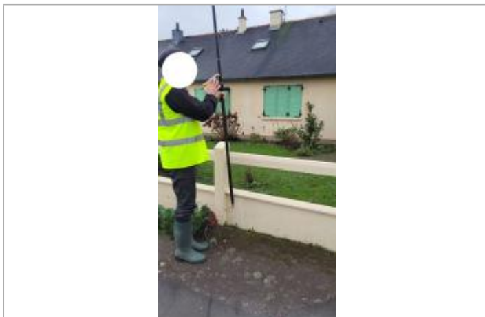
Muret devant le n°13 rue de Louvain le 29/01/2025