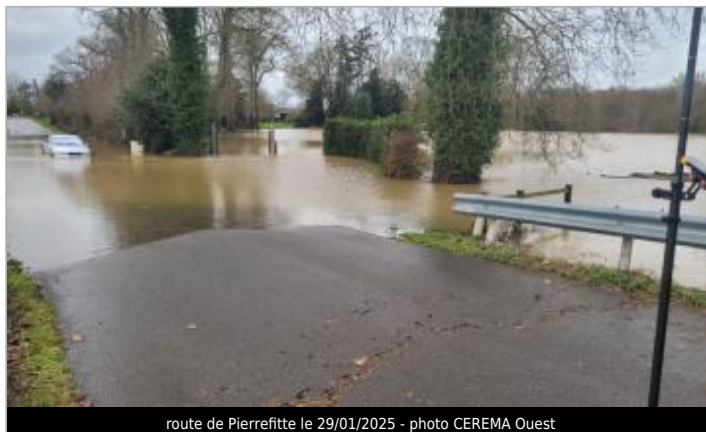
route de Pierrefitte le 29/01/2025