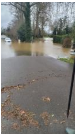
Laisse d'inondation sur la chaussée

Altitude calculée de l'eau (en m) : 18.807