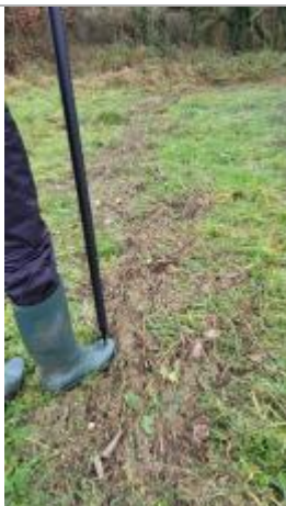
Relevé de la laisse d'inondation sur le bord du chemin de pan le 29/01/2025