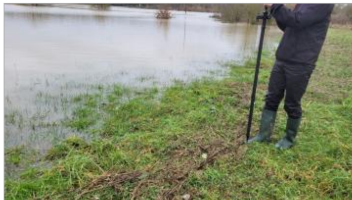
Bord du chemin de pan à Pont-Péan le 29/01/2025

Coordonnées WGS84 : X: -1.71594828 / Y: 48.02052740