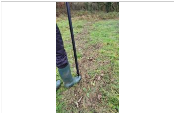
Relevé de la laisse d'inondation sur le bord du chemin de pan le 29/01/2025