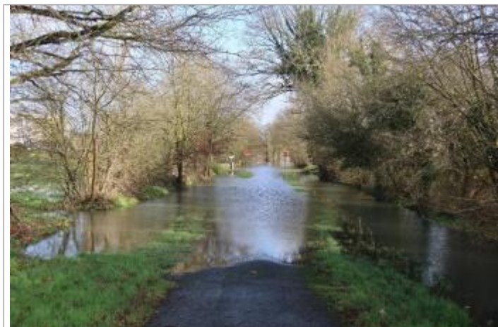
chemin des Touches le 30/01/2025 à 11:59