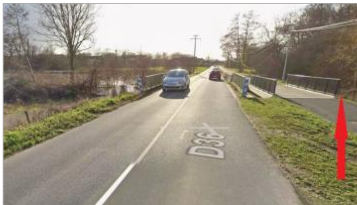
En aval des ponts de RD36 sur le ruisseau de Tellé

Coordonnées WGS84 : X: -1.69989379 / Y: 48.01876460