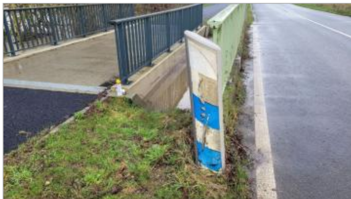
Pont cycliste de la RD36 le 29/01/2025

Coordonnées WGS84 : X: -1.69988098 / Y: 48.01871840