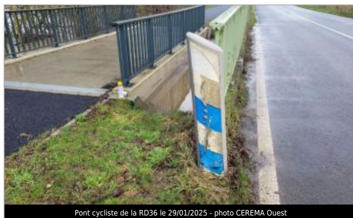
Pont cycliste de la RD36 le 29/01/2025

GÉOLOCALISATION Coordonnées WGS84 : X: -1.69988098 / Y: 48.01871840 Coordonnées RGF93 (Lambert 93) X: 349815.46 / Y: 6779128.38 Coordonnées RGF93 (ETRS89) : X: -1.699881 / Y: 48.0187184 Code Hydro: J74-0300 Rive de référence: Droite