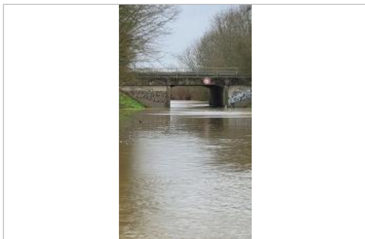
passage sous la voie-express RN 137 le 29/01/2025

Altitude calculée de l'eau (en m) : 20.749 m