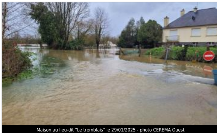
Maison au lieu-dit "Le tremblais" le 29/01/2025