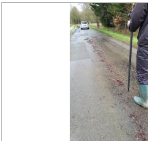
relevé de la laisse d'inondation sur la chaussée le 29/01/2025