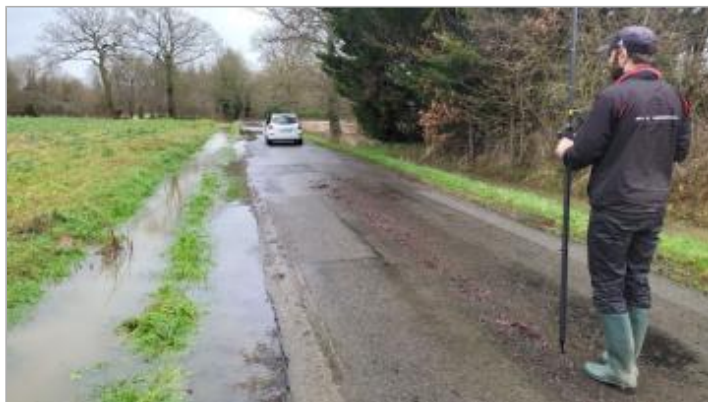
Chaussée sur la route de la rivière le 29/01/2025

Coordonnées WGS84 : X: -1.68078479 / Y: 48.02703590