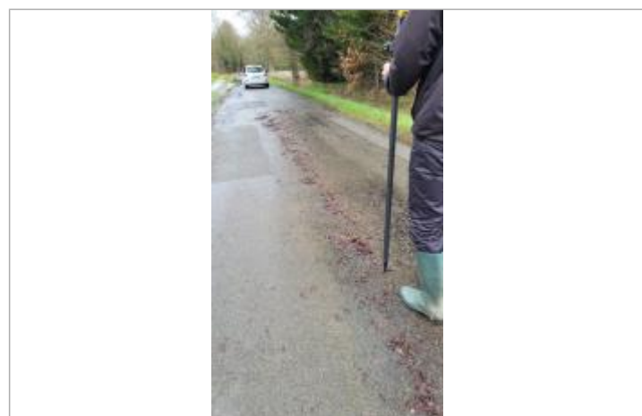
relevé de la laisse d'inondation sur la chaussée le 29/01/2025

GÉNÉRAL Code : SPC_35363-003_2025 Date de mise à jour : 16/10/2025 Auteur : SPC VCB